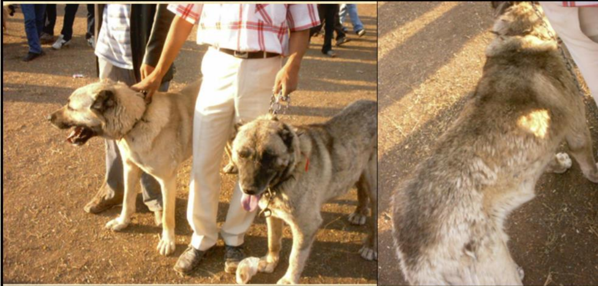
Resim 3. Kaplan deseni, siyahın etkisini kaybederek dikey çizgiler halinde ana rengin arasında kendini göstermesiyle oluşur. Sağdaki köpek tam kaplan deseni etkisini göstermeyen bir ara renge sahip. Kangal Köpeği'nde oldukça nadirdir ve öyle de bırakılmalıdır.

geldiğinde köpek siyah maskeli kızıl sarı olur. Tek bir "ebr" aleliyle ise kızıl-sarı alanlar koyu çizgilerle gölgelenir.