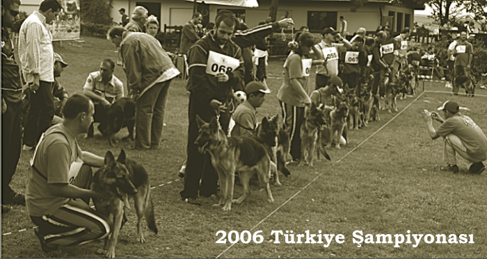
2006 Türkiye Şampiyonası

Ülkemizde de “Alman Kurdu” tanımı ile çok popüler olan Alman Çoban Köpeği, ne yazık ki bu aşırı popülerliğin kurbanı olmuştur. 2004 yılında dernekleşen ve soy kütüğü tutmaya başlayan, 2008 yılında 350 köpek katılımı ile Doğu Avrupa'nın en