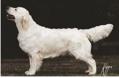
1998 İngiltere Şampiyonu Gatchells Royal Orchid JW